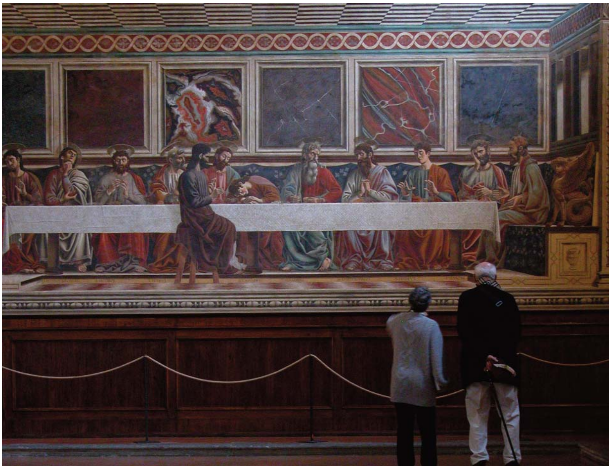
Cenacolo Santa Appollonia, Firenze de Andrea Del Castagno