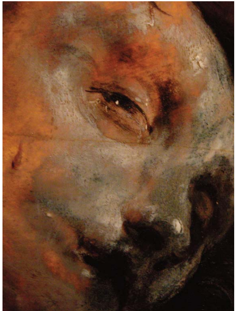
Eccehomo de Crespì (musée de Strasbourg)