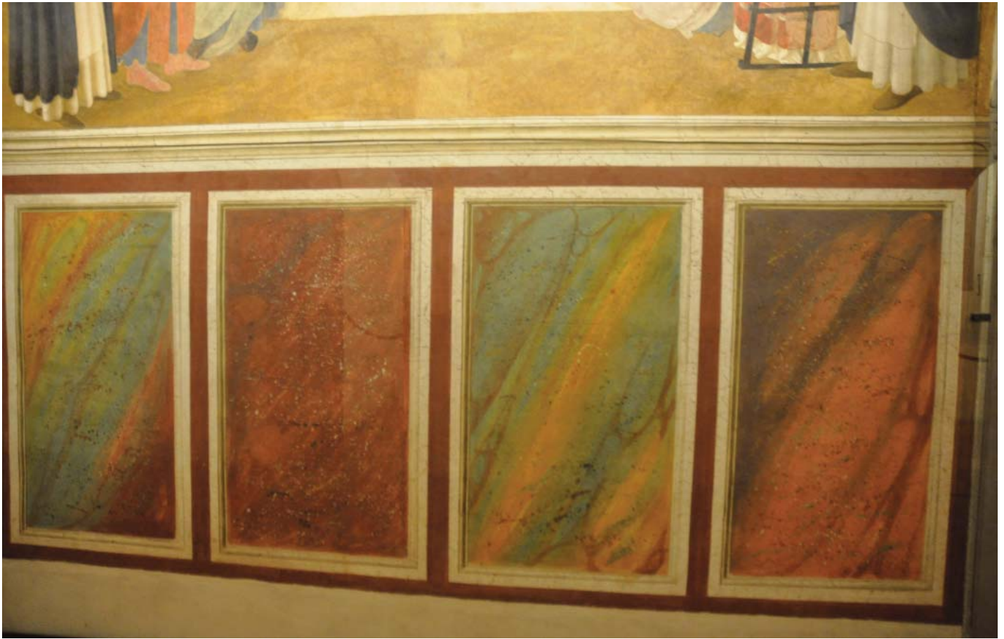
Marmi pinti de Fra Angelico à SAn Marco, Firenze