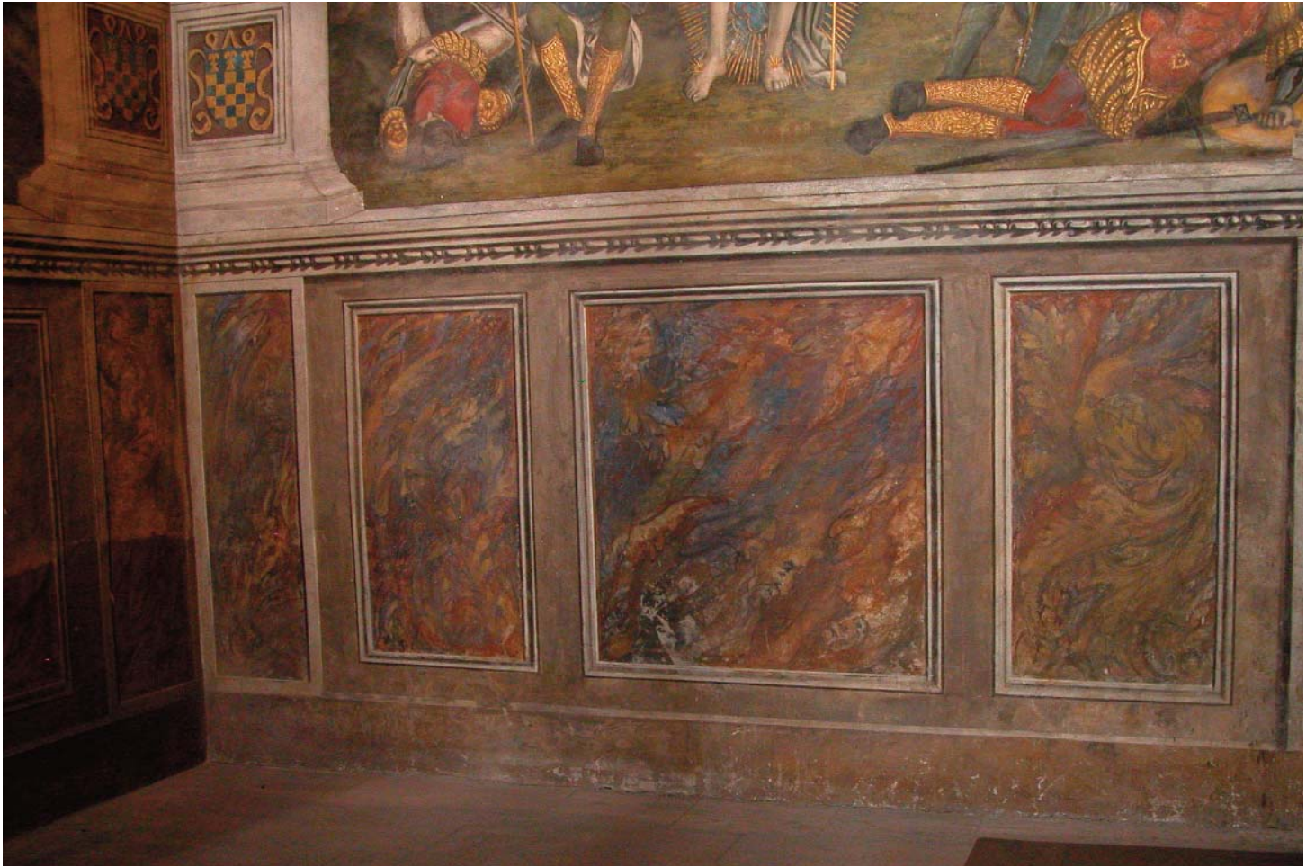
marmi pinti habités du choeur de la cathédrale d'Albi