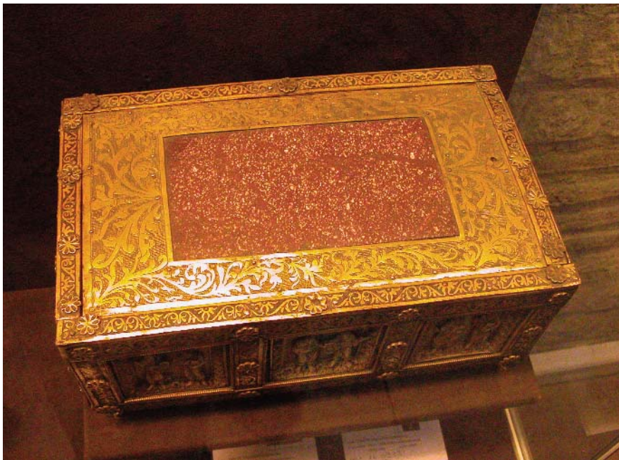
Autels portatifs et coffres romans, avec incrustations de marbre