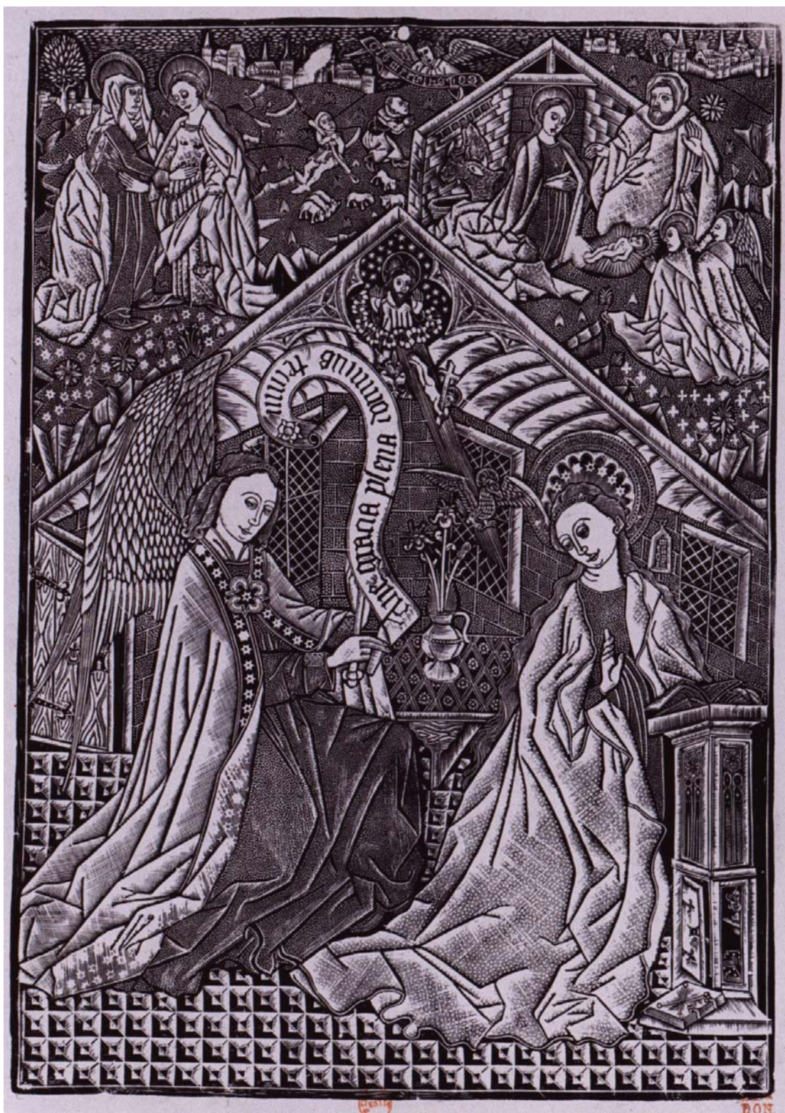
vers 1460 Cologne (?) Tirage 1912 (manière d'épargne) L'annonciation avec la Visitation et la Nativité