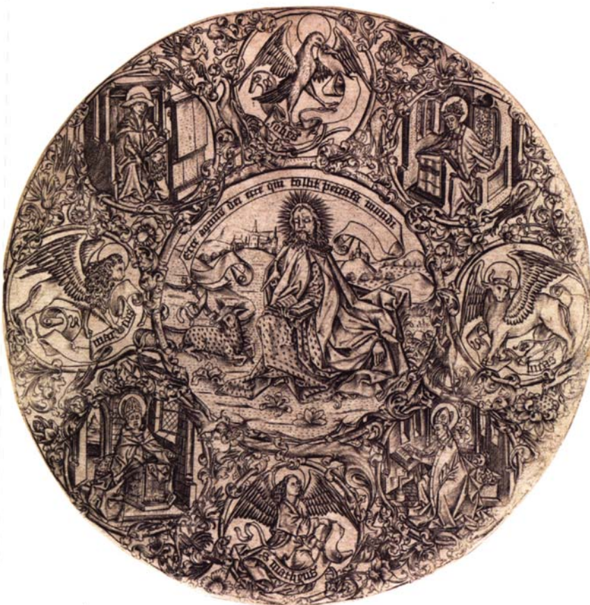
Israhel Van Meckeren 1470 - burin Baptiste entouré des quatre pères de l'Église