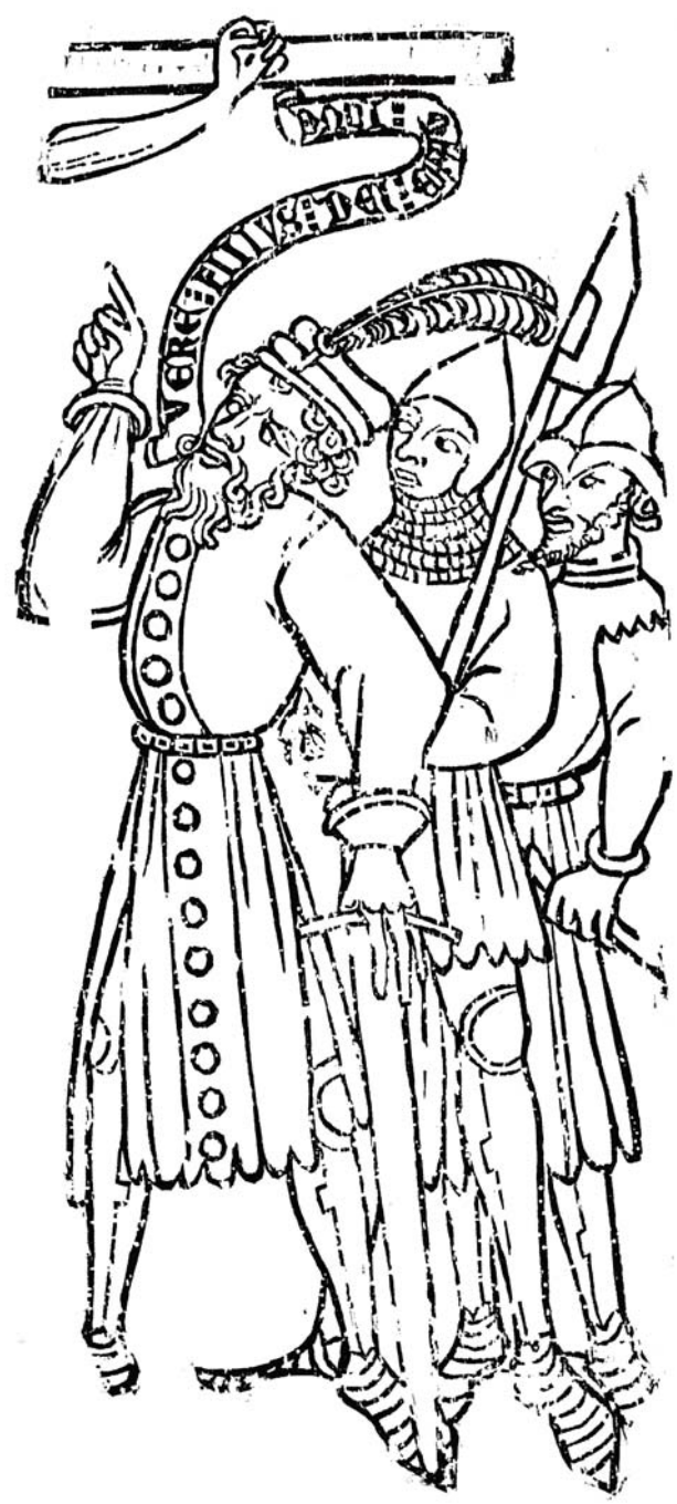
Le bois Protat