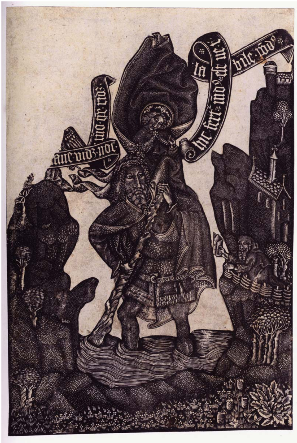
vers 1450 Rhin supérieur Saint Christophe