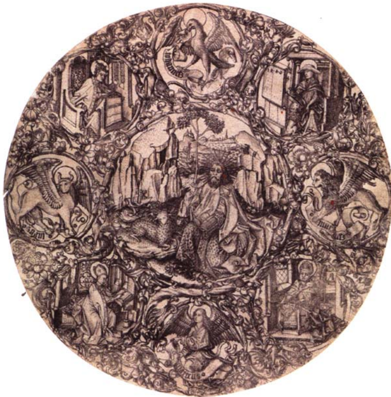
Maître E.S. 1466 - burin Baptiste entouré des quatre pères de l'Église