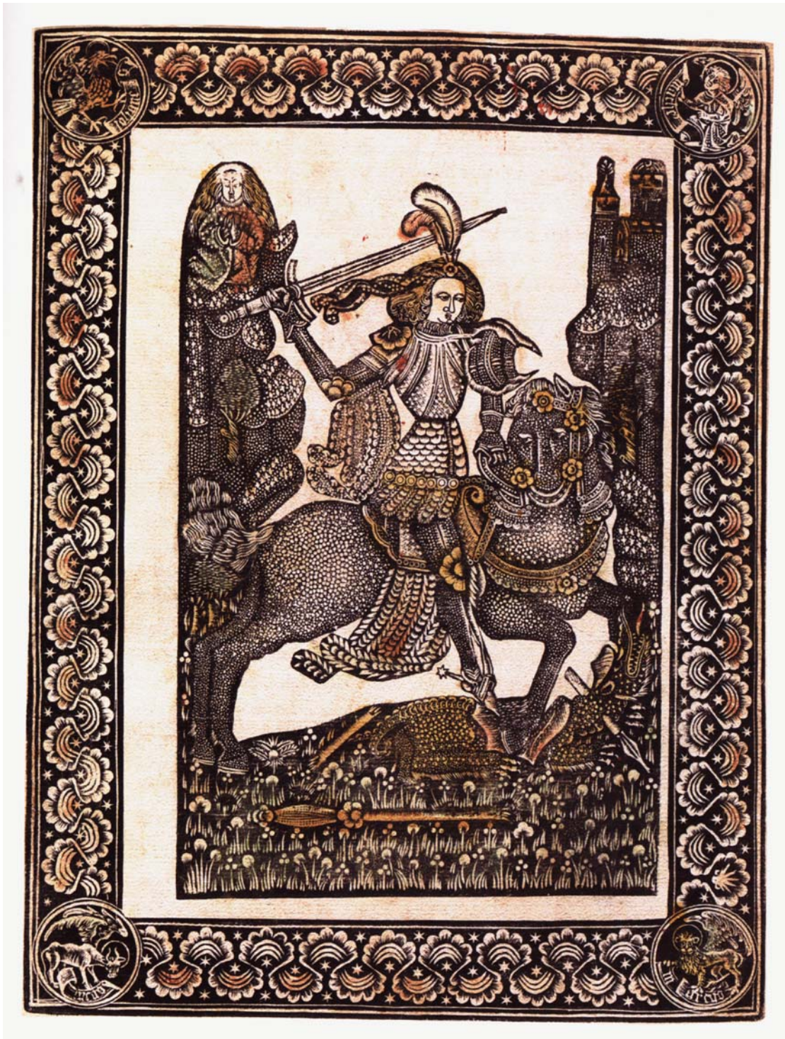
vers 1450 Bavière Saint Georges