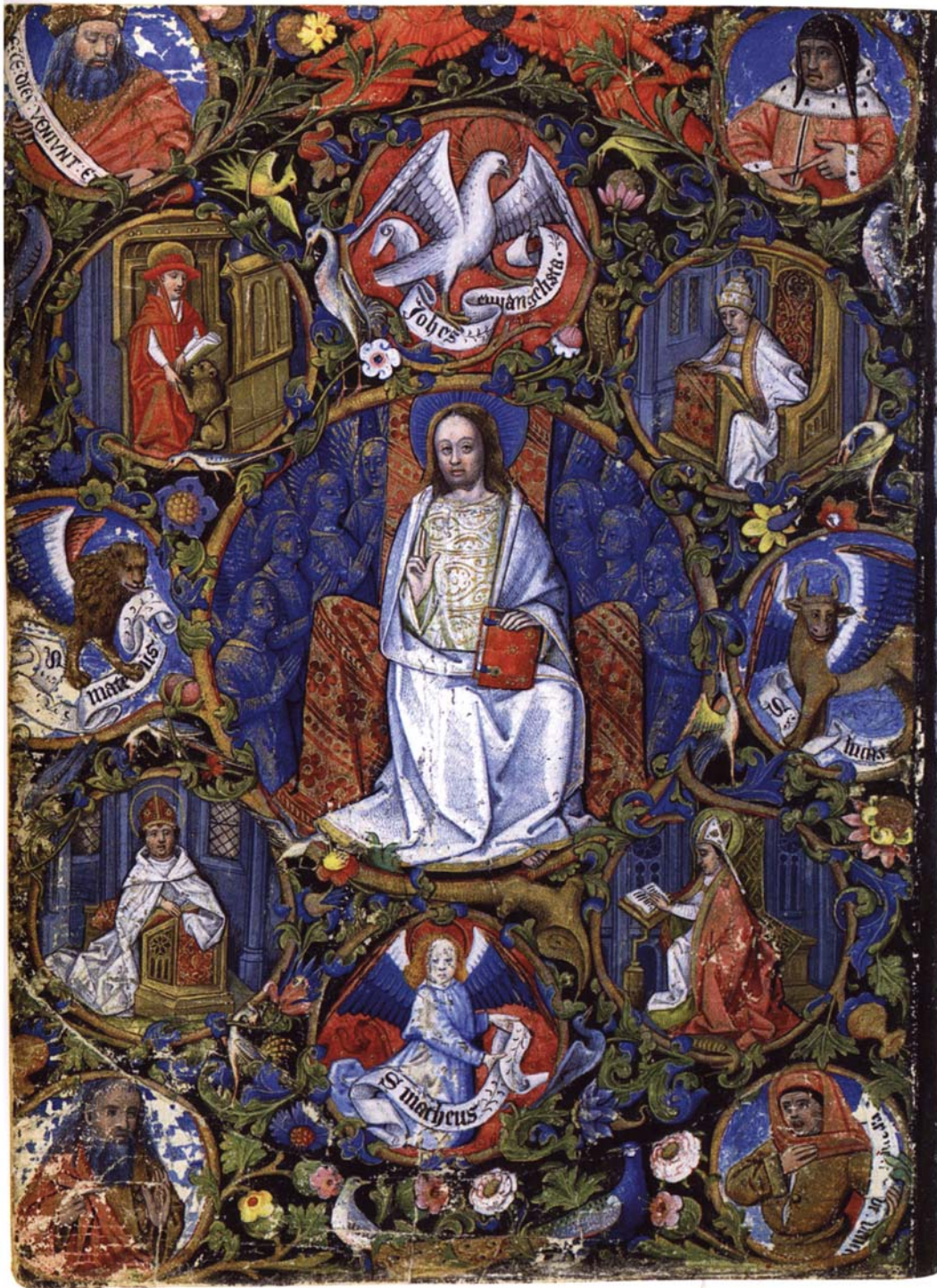
Robinet Testard Le Christ en majesté entouré des quatre pères de l'Église (Heures de Charles d'Angoulême)