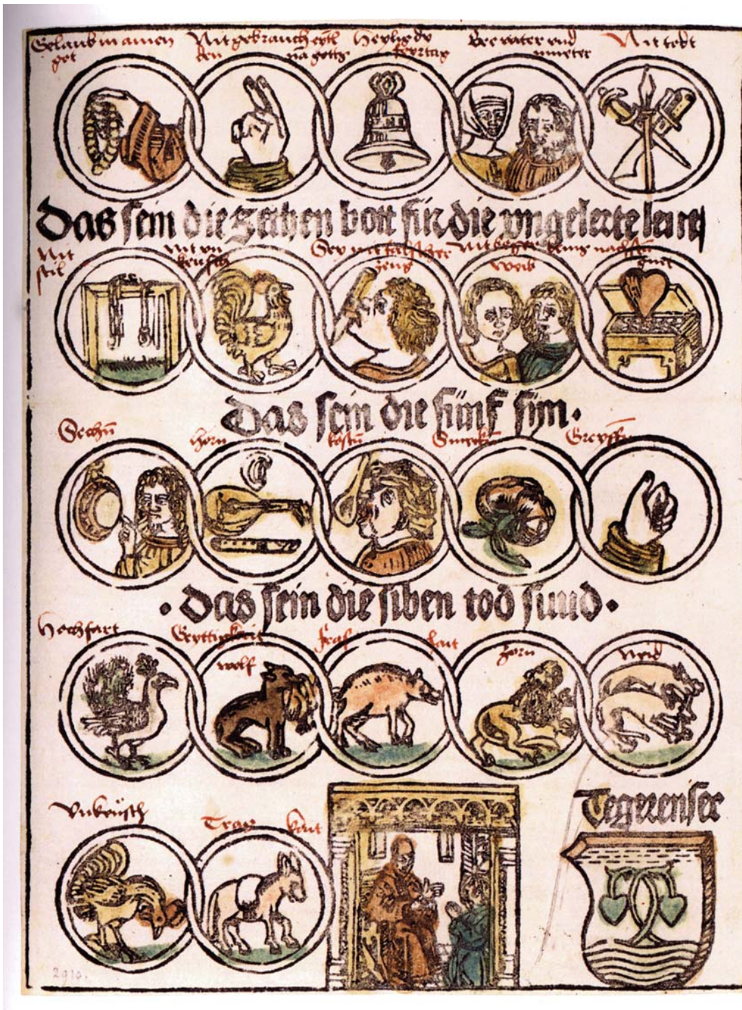
Xylographie - Bavière - vers 1480 Les dix commandements, les cinq sens, les sept péchés capitaux