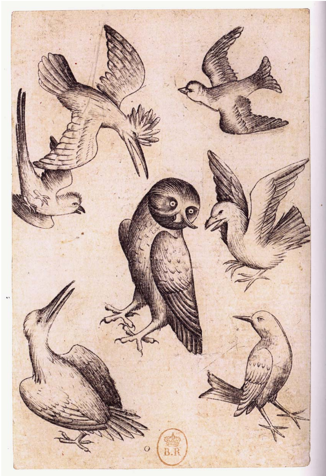
Maître des cartes à jouer